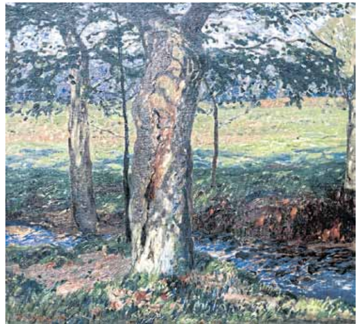
Fritz Overbeck, „Alter Baumstamm“, 1909, Öl auf Leinwand, 71,5 x 76,5 cm Overbeck-Museum, Bremen

Noch bis zum 31. März sind Familien, Kindergruppen und Schulklassen im Museum im Deutschhof dazu eingeladen an der interaktiven Ausstellung „Donnerwetter! Klima schreibt Geschichte“ teilzunehmen. Im Rahmen dieser