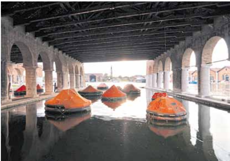
Installationsansicht: Tamara Grcic, „Gaggiandre“, 2009, La Biennale di Venezia, 53. Esposizione Internazionale d'Arte