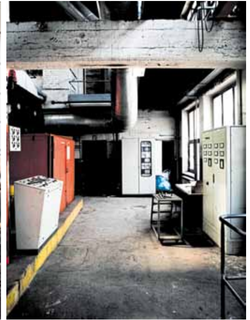
Sebastian Mölleken, 120 cm x ca. 1 m, auf Dibond kaschiert, aus einer Serie über die Rheinenergie Kraftwerke in Köln, 2011.

Die contemporary art ruhr (C.A.R) verändert sich. Nach 12 Jahren nennt sich die Frühjahrsausgabe der Kunstmesse C.A.R. PHOTO/ MEDIA ART FAIR und richtet sich mit Fotografie als Schwerpunkt neu aus. Zwar spielte Fotografie schon immer eine besondere Rolle, mit dem neuen Namen und Termin soll die Veranstaltung ab dem kommenden Jahr auf dem spektakulären Gelände des Welterbes Zollverein eine neue Ausrichtung bekommen. Das Spektrum der PHOTO/MEDIA ART FAIR reicht vom Themen-Schwerpunkt Fotografie über Installation, Virtual Reality-Kunst, Licht- und Videokunst, Kunst-Apps bis hin zur Skulptur. Damit wird die Frühjahrs-Kunstmesse für aktuelle Entwick-