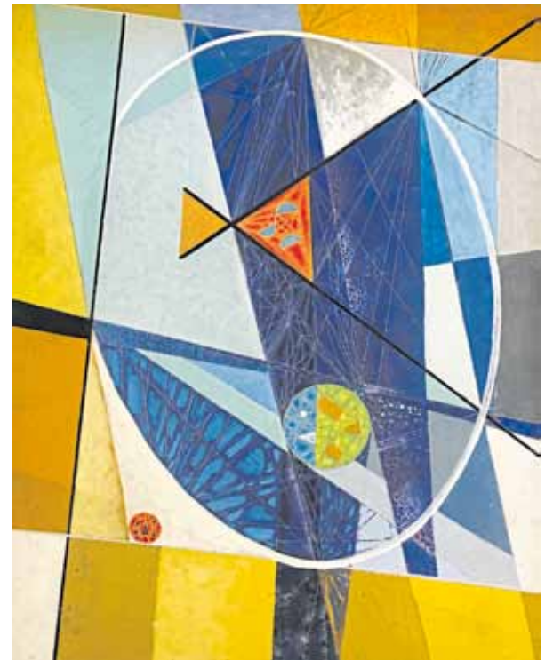
Fritz Kuhr, „Zeitfenster“, 1952, Öl auf Faserplatte, 85,5 x 60 cm