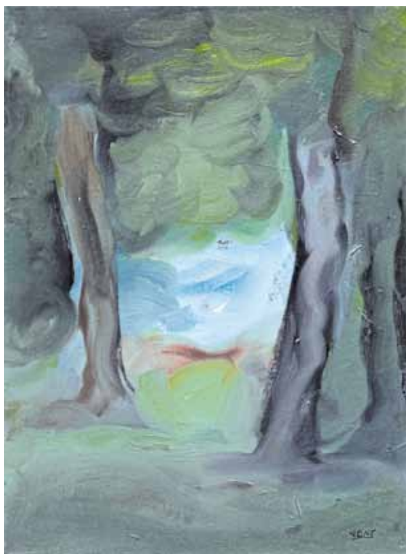
Hans Vent, „Durchblick“, Öl auf Leinwand, 2014, 400 x 300 cm

Museen und Galerien widmen sich in ihrem Ausstellungsprogramm Kunst aus Deutschland/Von Elena Zompi