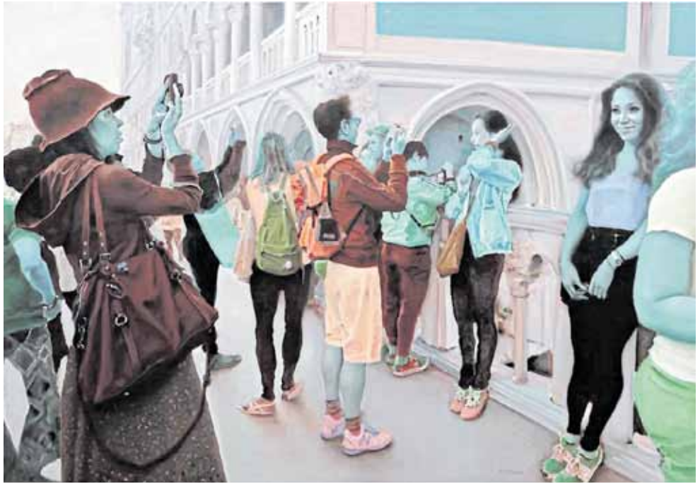
Pang Maokun, „Einer der Passagiere“, 2014, Öl auf Leinwand, 180 x 260 cm, 2014

Der Künstler Pang Maokun ist als klassischer Maler der zeitgenössischen chinesischen Ölmalerei bekannt. Der 1963 in Chongqing geborene Kunstschaffende studierte von 1981 bis 1988 an der Hochschule der Künste Sichuan und erlangte dort einen Master in Ölmalerei. Seit seinem 16. Lebensjahr sind seine Werke Teil bedeutender Ausstellungen in ganz China und spätestens seit den 1980er-Jahren auch international bekannt. Seine langjährige künstlerische Tätigkeit zeigt systematisch die eingehende Forschung traditioneller westlicher Ölgemälde und stellt immer wieder die Erkundung und Innovation von Gegenwart und Zukunft dar. Als ruhiger Zuschauer betrachtete und beschrieb er klassisch und zeitgenössisch, vor allem in den letzten zehn Jahren, indem er moderne Gemälde entwickelte, die auf Realismus basierten und sich mit Symbolismus und Surrealismus auszeichneten. Bis zum 16. April werden Werke