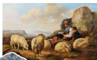
Eugène Verboeckhoven, „Schäfer bei der Rast“, HxB: 77/125 cm, Limit: EUR 8.000.-