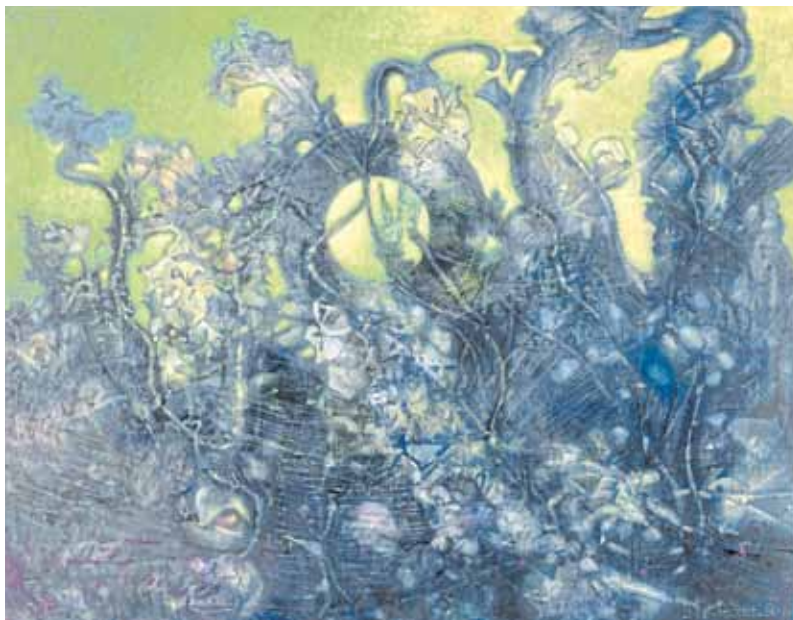
Max Ernst, „Der letzte Wald“, 1960, Öl auf Leinwand, 114 x 145,5 cm, Musée d'art moderne et contemporain de Saint-Étienne Métropole (Saint-Étienne), Centre Pompidou, Musée d'Art Moderne de Saint

Unsere Umwelt ist gefährdet und befindet sich im Wandel und das nicht erst seit gestern, dennoch häufen sich gerade jetzt die Aktionen, Aufschreie und mahnenden Worte. Aus allen Kehlen heißt es „Wir haben nur einen Planeten und den müssen wir schützen“. Vor allem die nachfolgende Generation fordert für sich eine intakte Natur. Unter dem Hashtag Fridaysforfuture gehen jeden Freitag vielerorts Schüler auf die Straßen und demonstrieren für Nachhaltigkeit, Nachsicht und mehr Sensibilität der Umwelt gegenüber.