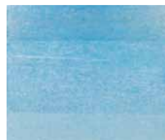
Jacob Bräckle, Winterlandschaft, Öl/Lw, HxB: 70 x 82 cm, Limit EUR 10.000.-