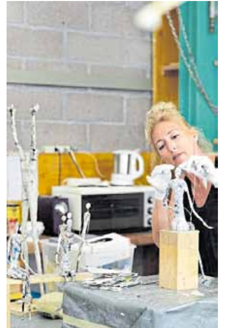
Impressionen der Scuola di Scultura in Peccia.; von links nach rechts: Aktmodellieren, Steinbildhauen, Papierfiguren modellieren.

Die Marburger Sommerakademie für Darstellende und Bildende Kunst ist bundesweit die älteste ihrer Art. Die 42. Ausgabe findet dieses Jahr vom