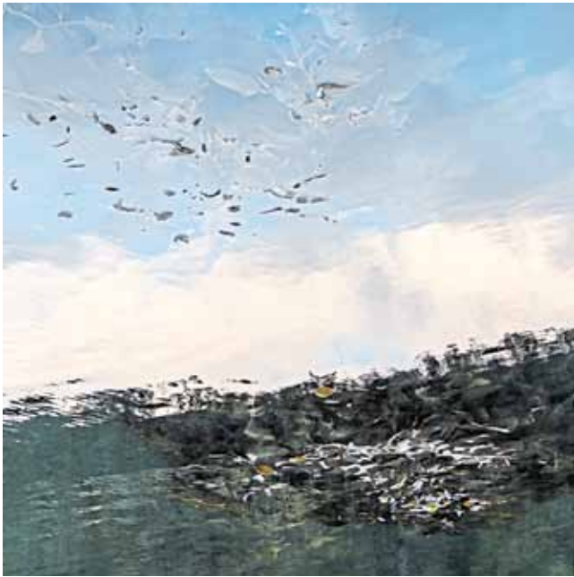
Dierk Maass, „54° 52' 54.271'' S 69° 31' 37.122'' W“, 2012, Leuchtbild, Edition 6+2, 60 x 60 cm

Spannende Ausstellung von The View Contemporary Art