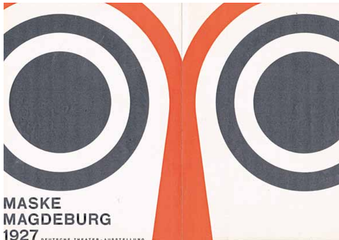
Wilhelm Deffke, Kleinplakat „Die Maske“ zur Theater-Ausstellung in Magdeburg, 1926/27

Es gibt wohl keinen besseren Anlass, um Kunst aus Deutschland in den Mittelpunkt zu rücken. Denn in diesem Jahr kommen gleich drei wichtige hundertjährige Jubiläen für Deutschland zusammen. Neben dem hundertjährigen Bauhaus-Jubiläum, das momentan die Museumslandschaft zu dominieren scheint, gilt es in Deutschland zwei weitere sehr wichtige Begebenheiten zu feiern: die Gründung der Weimarer Republik und das Frauenwahlrecht – beides historische Ereignisse, die 1919 stattfanden und Deutschland nachhaltig geprägt haben. Zeitkunst stellt Ihnen eine Auswahl spannender Ausstellungen vor, die zeigen, wie sich diese Geschehnisse und die Veränderungen, die sie mit sich gebracht haben, in der Kunst widerspiegeln. Doch nicht nur um diese drei Jubiläen soll es bei unserer Übersicht gehen, sondern auch Ausstellungen, die deutschen Künstlern im Allgemeinen gewidmet sind.