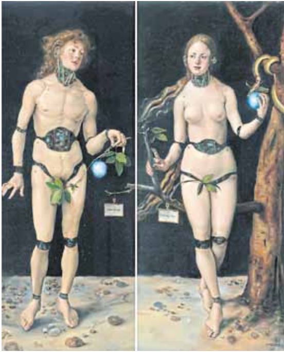
Pang Maokun, „Folding Eden“, 2017, Öl auf Leinwand, 200 x 85 x 2 cm

Einzelausstellung des Künstlers Pang Maokun im Beijing Minsheng Art Museum