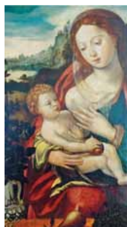
MEISTER MIT DEM PAPAGEI (Antwerpen, Erstes Drittel des 16. Jahrhunderts), „Maria lactans“, Bildausschnitt, Öl/Holz, aus Privatsammlung, Limit EUR 50.000.-

Insges. ca. 3.000 Lose. Zum Aufruf kommen angewandte Kunst 16.-21. Jh., Kunsthandwerk, Tribal Art, Alte Weine, Collectibles, Einrichtungskultur