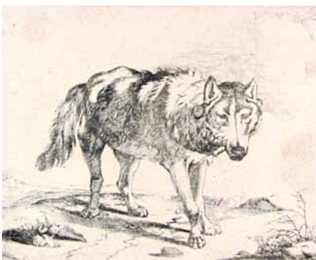
Marcus de Bye (um 1639 – nach 1688), „Wolf in Dreiviertelansicht, (nach Paulus Potter)“, 1659, Radierung, 245 x 186/189 mm, Graphische Sammlung, Wallraf-Richartz-Museum

Die neueste Ausstellung des Wallraf-Richartz-Museum widmet sich dem Mythos Wolf